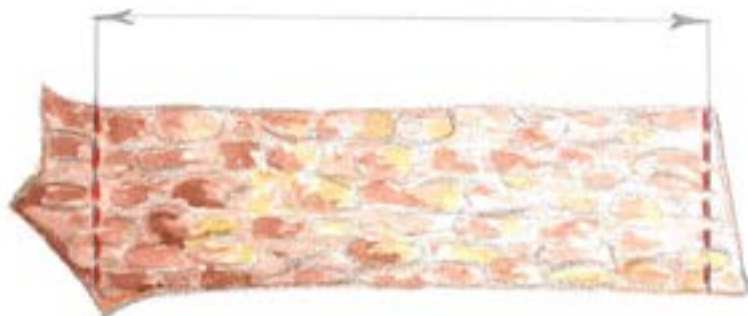
Reālais sortimenta garums.

Malkai sagatavo koksni, kura kvalitātes vai nelielo dimensiju dēļ nav izmantojama citu sortimentu iegūšanai. Liela daļa malkas koksnes šobrīd mūsu valstī tiek pārstrādāta granulās. Arī malkas uzpircēji var izvirzīt specifiskas prasības piegādājamiem sortimentiem – minimālo un maksimālo diametru, nevēlamo koku sugu sastāvu u.c. Lai apaļos kokmateriālus būtu vieglāk transportēt, arī malkas sortimenta garums visbiežāk ir 3 m.