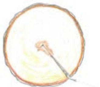
Žūšanas plaisa skar mizu – finierklucis tiek brāķēts.

Apalkoksnēs kvalitāte var pasliktināties arī uzglabāšanas laikā. Žūšanas plaisas, marmora trupe, zilējums un kukaiņu ejas var būt par iemeslu, kādēļ augstvērtīgi sortimenti tiek brāķēti un elites klases finierkluči jāpārdod par papīrmalkas vai malkas cenu, bet A klases zāģbaļķi – par guļšņu koksnes cenu. Pavasarī, sulu laikā, un vasarā cirsta koksne savu kvalitāti var zaudēt dažu nedēļu laikā.