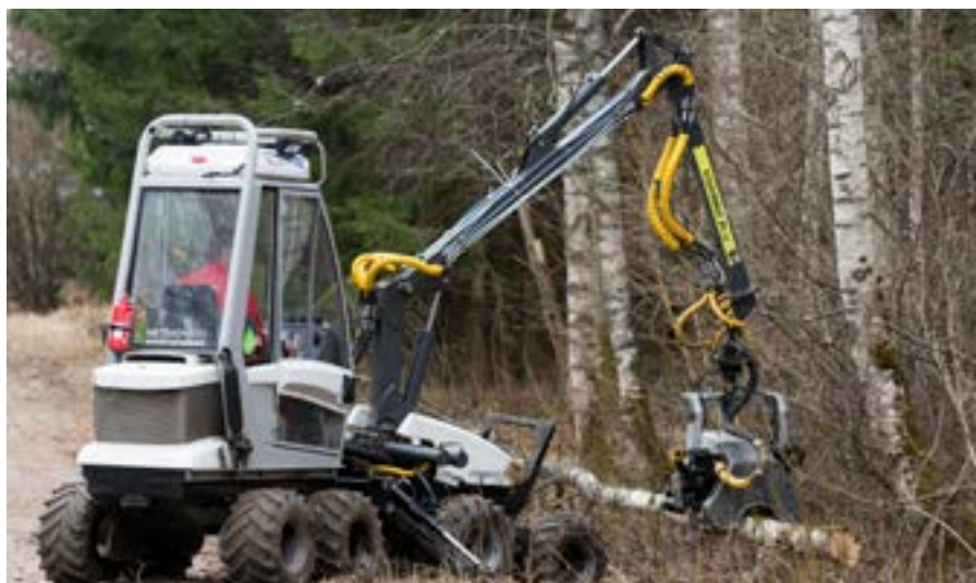
Mazjaudas harvesters Vimek 404T.