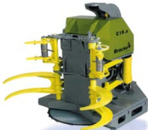
Akumulējošā griezējgalva Bracke C16B.