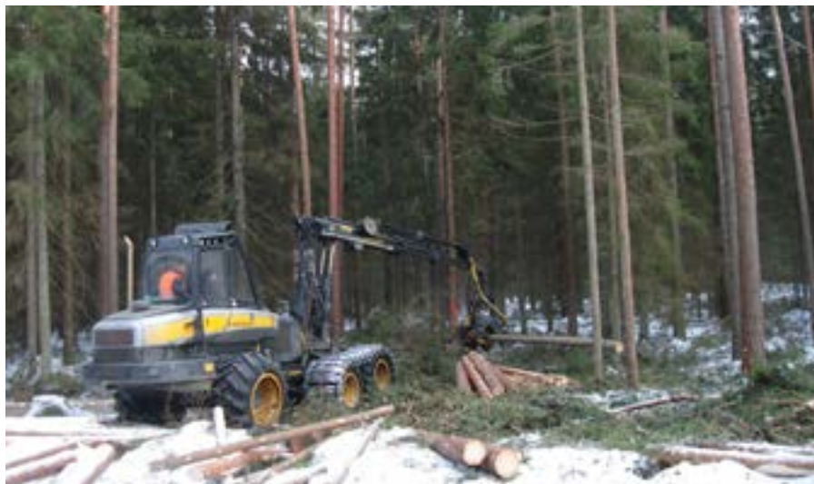
Harvesters Ponsse Ergo.

des darbos kailcirtēs, izlases un pakāpeniskajās cirtēs, kā arī kopšanas cirtēs.