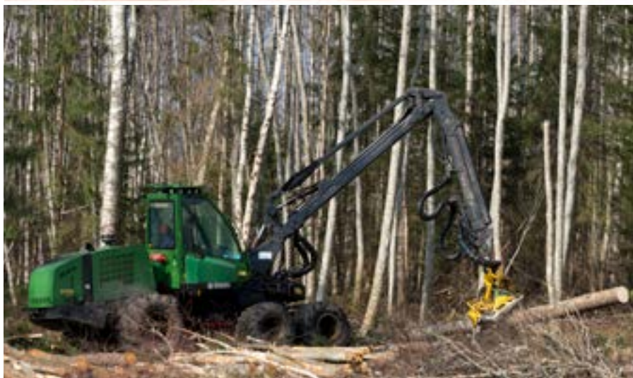
Harvesters John Deere 1070E.

Minētās mašīnas mežizstrādē prasa augstākas darbu izmaksas, toties augstāks ir to darba ražīgums: tās apgādātas ar akumulējošām (paketējošām) griezējgalvām, kā Bracke C16.B , un var veikt darbus arī meža kopšanas cirtēs, sagatavojot daļēji atzarotus sīkkokus šķeldas un granulu ražošanas uzņēmumiem. Šīs mašīnas izmanto mežizstrā-