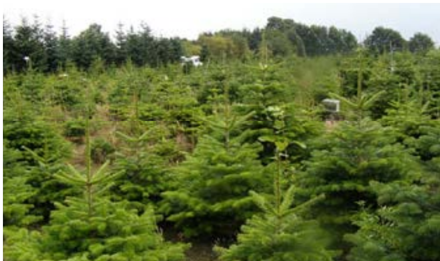
Piecgadīga garzviņu balzāma baltegles plantācija.

LVMI Silava pagājušā gadsimta beigās un 21. gs. sākumā veica ZK plantāciju izveides izmēģinājumus, atlasot sugas, izvēloties augšanas vietas, izdarot kopšanu un vainagu veidošanu, pētot realizācijas iespējas un izvērtējot ZK augšanas ekonomisko efektivitāti. Pētījumos noskaidrots, ka ZK plantāciju izveidei Latvijas apstākļos piemērotākās skujkoku sugas ir: balzāma baltegle ( Abies balsamea (L.) Mill.), garzviņu balzāma baltegle ( Abies balsamea var. phanerolepis Fern.), Korejas baltegle ( Abies koreana Wils), Veiča baltegle ( Abies veitchii Lindl); valsts dienvidu un dienvidrietumu daļā iespējama Nordmaņa baltegles ( Abies nordmanniana (Stev.) Spach.) audzēšana. Iecienīts ZK Latvijā ir asā egle ( Picea pungens Enelm.) un tās šķirnes.